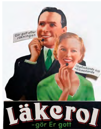
Butiksskylt från 1930-talet.