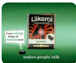
Dagens reklamfilmer har ett tydligt budskap: Läkerol makes people talk.