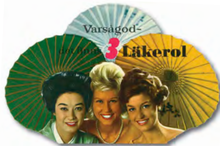
Jubileumskampanj från 1960.