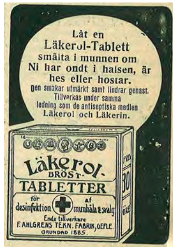
Den första annonsen införd 19 december 1909.