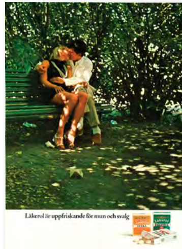
Romantik lockade unga köpare. 1969 tog reklambyrån Hera fram dessa annonser.